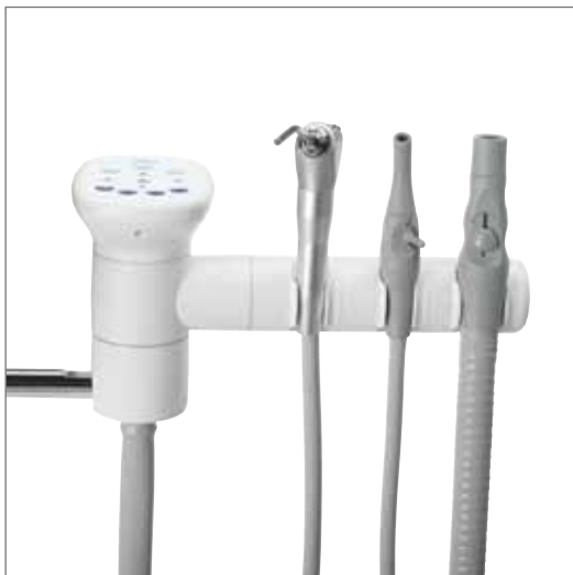
Jeden držák se třemi polohami nastavení, na obrázku s volitelným ovládacím panelem a pistolí.

Podtlakové nástroje můžete díky držáku se třemi polohami nastavení a teleskopickému rameni umístit tak, aby byl přístup k pacientu co nejsnazší.