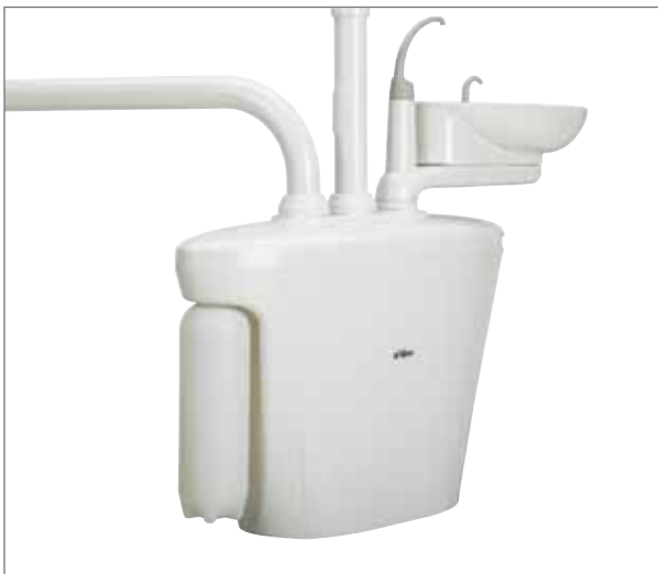
Láhev na vodu s uzavřeným systémem.

Porcelánové plivátko lze natočit do požadované polohy. Dvoulitrová láhev na vodu se snadno naplní a zajistí neustálý přísun tekutiny pro velký počet zákroků. V centrálním bloku je dostatek místa pro uložení doplňujících materiálů, jako jsou separátory amalgámu a vakuové systémy.